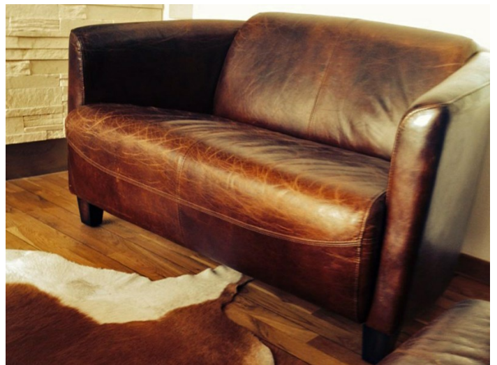
Surface brillante: crème à lustrer

Nous conseillons de soigner les zones fortement sollicitées d'un cuir aniline neuf, plusieurs fois, pour éviter les taches et la décoloration. Les zones fortement sollicitées doivent être traitées tous les trois mois. Pour le reste, les intervalles de 6 à 12 mois suffisent.