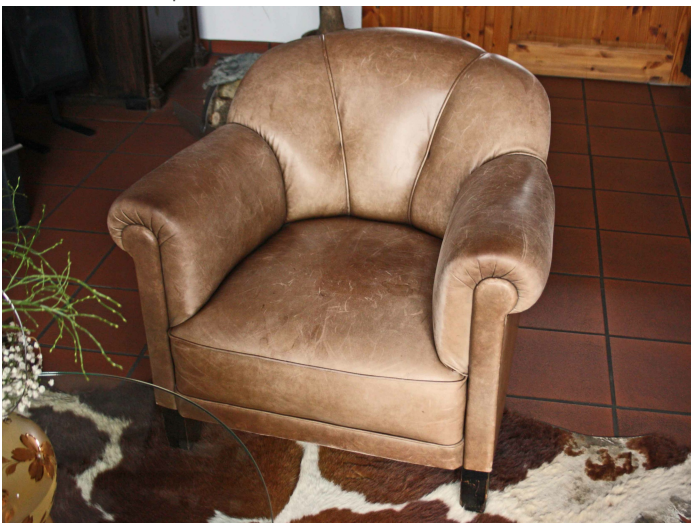
Cuir mat : crème aniline

Pour les cuirs à pores fins, veuillez utiliser notre protection intensive : crème aniline COLOURLOCK . Appliquée régulièrement, la crème aniline a un fort effet imperméabilisant contre tous les types de taches et salissures. Important : la protection antitache ne peut fonctionner que si le cuir est traité dès le début de l'utilisation. Si le cuir est déjà taché, il est presque impossible de pouvoir le détacher sans faire appel à une société spécialisée. Par conséquent, il est très important d'entreprendre les bonnes mesures de préventions.