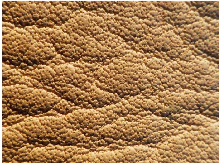
Cuir aniline à pores grossiers