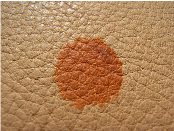
Cuir aniline très poreux et sensible

Les cuirs de couleurs plus claires et sans couche protectrice sont particulièrement sensibles aux taches. Dans de tels cas, l'imperméabilisant est le premier choix. Ceci s'applique également au cuir aniline à pores grossiers. Pour les cuirs aniline plus vieux et plus secs, nous conseillons le protecteur aniline COLOURLOCK pour nourrir, adoucir et conserver le cuir.